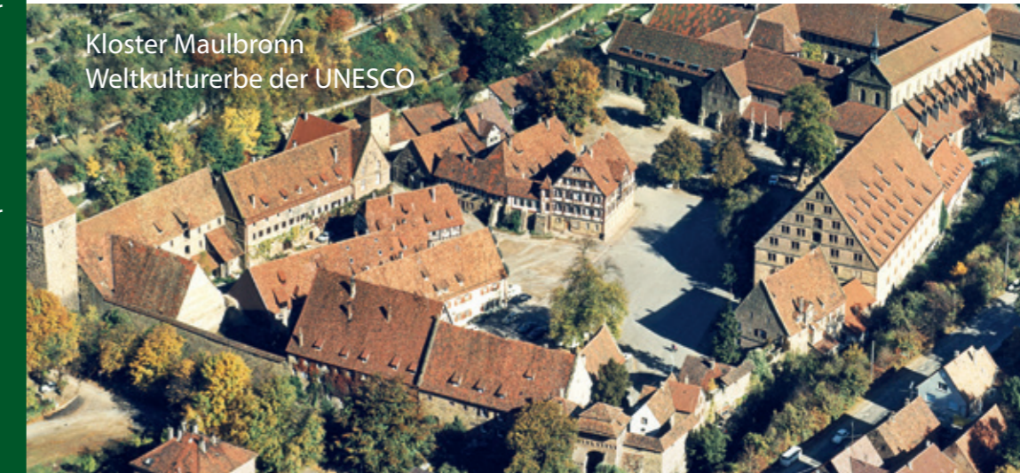
Kloster Maulbronn Weltkulturerbe der UNESCO

Permanenter IVV Wanderweg 7 und 15 km „Auf den Spuren der Mönche“